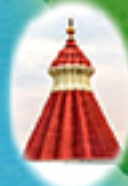
Kalady (Birth Place of Shankaracharya)

अवतीर्णश्च कालट्यां केदारेऽन्तर्हितश्च यः । चतुष्पीठप्रतिष्ठाता जयतात् शङ्करो गुरुः ॥